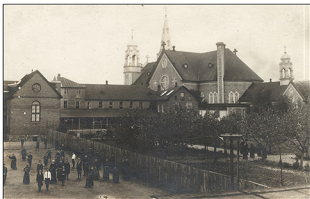
L'église vers 1924