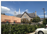
Municipalité d'Ottawa en 1907.