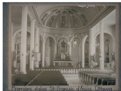
L'intérieur avant l'ajout des tribunes latérales

En collaboration avec Desjardins Caisse populaire Rideau-Vision d'Ottawa