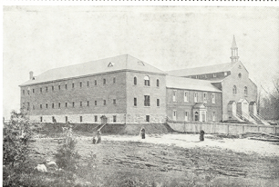
MONASTERE ET PREMIERE EGLISE.— Vue d'ensemble.

L es plans de la première église Saint-François-d'Assise (1891) sont dessinés par l'architecte Jude Routhier (1863-1949). Il travaillait à son propre compte depuis 1889 avant d'entrer au ministère des Travaux Publics en 1892 devenant ainsi collaborateur de Thomas Fuller (1823-1898), l'architecte des édifices du Parlement à Ottawa.